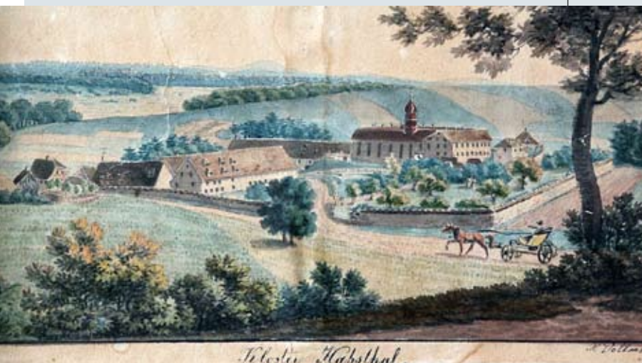
KLOSTER HABSTHAL UM 1830 Aquarell von X. Vollmer auf dem Zifferblatt einer Uhr

Das Kloster Habsthal kann 2009 auf eine 750jährige Geschichte zurückblicken. In einer Urkunde vom 20. Mai 1259 übergibt Pfalzgraf Hugo IV. von Tübingen seine Besitzungen in Habsthal an eine fromme Frauengemeinschaft, eine sog. Beginen-Sammlung, die sich einige Jahr zuvor im Kontext der mittelalterlichen Frömmigkeits- und Armutsbewegung im benachbarten vorderösterreichischen Städtchen Mengen gebildet hatte. Noch im selben Jahr erfolgt die Grundsteinlegung für den Bau einer Kirche und eines Klosters, in das die Mengener Schwestern in der Folge übersiedeln.