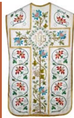
MESSGEWAND UM 1900 aus der Habsthaler Paramentenwerkstatt

DAS BENEDIKTINERINNENKLOSTER ist eine kontemplative Gemeinschaft mit einer bis zu den Reformen des 2. Vatikanischen Konzils bestehenden Zweiteilung in dem lateinischen Chorgebet verpflichtete Chorfrauen und vorrangig in der Klosterökonomie tätige Laienschwestern. Ihren Lebensunterhalt bestreiten die Benediktinerinnen lange Zeit aus der gärtnerischen und landwirtschaftlichen Bewirtschaftung des umfangreichen Klosterhofes, in den 1920/30er Jahren zeitweilig aus dem Betrieb einer Näh- bzw. Fortbildungs- und Kochschule und vor allem aus den Einkünften einer überaus erfolgreichen Paramenten- und Stickwerkstatt. Sowohl kirchliche Einrichtungen wie auch zahlreiche Vereine in weiter Umgebung finden sich unter den Kunden der kunsthandwerklich talentierten Klosterfrauen, deren Produktpalette von kunstvoll bestickten Messgewändern bis zu Jubiläumshähnen für Feuerwehren