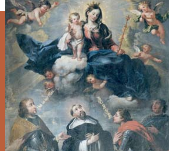
HOCHALTAR-GEMÄLDE VON MATTHÄUS ZEHENDER VON 1691 mit Muttergottes mit Kind und Klostergründern (Ausschnitt)

In der langen Klostergeschichte lassen sich insgesamt FÜNF AUSBAUPHASEN feststellen: Auf die Begründung des Klosters in der bereits bestehenden Siedlung Habsthal in der Mitte des 13. Jahrhundert folgt nach einem verheerenden Brand 1363 ein Wiederaufbau, an den sich um 1500 ein von der Spätgotik geprägter Umbau und die Errichtung einer von den Herren von Hornstein gestifteten Chorkapelle anschließen. Das heutige bauliche Erscheinungsbild von Kloster Habsthal ist barock bestimmt und geht auf den von Jodokus Beer geleiteten Wiederaufbau von Kirche und den drei Konventsflügeln in der zweiten Hälfte des 17. Jahrhunderts nach den Verwüstungen des 30jährigen Krieges zurück. In der Mitte des 18. Jahrhunderts werden die bislang schlichte Klosterkirche sowie Priorat, Refektorium, Kapitelsaal und weitere Konventsteile in einem eleganten Spätbarock modernisiert.