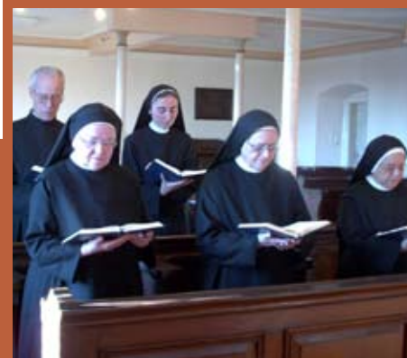
DIE BENEDIKTINISCHE KLOSTER-GEMEINSCHAFT BEIM CHORGE BET

und Gesangsvereine reicht. Stark rückläufige Beitritte von Novizinnen bereits seit den 1960er Jahren lassen die Klostergemeinschaft zunehmend altern und schrumpfen, so dass aufgrund des fehlenden Nachwuchses die Paramentenwerkstatt wie auch die klösterliche Landwirtschaft aufgegeben werden müssen.